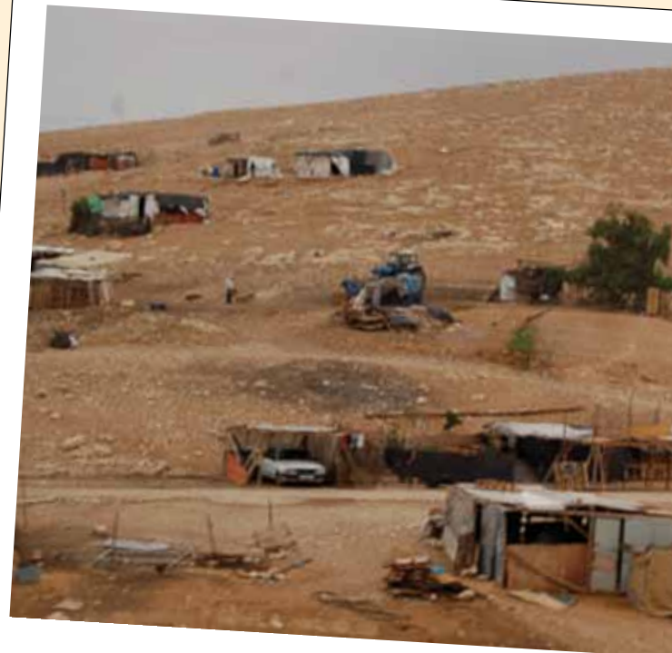
Ergens onderweg: een bedoeïenkamp.